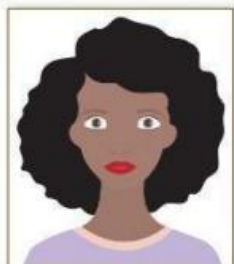
Figura 1. Modelo de Foto Frontal.