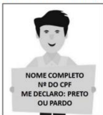
Figura 3. Modelo de Autodeclaração para o vídeo.